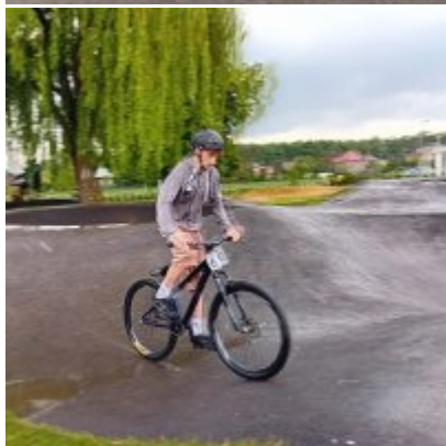
MIĘDZYNARODOWY PUCHAR POLSKI „PUMPTRACK”