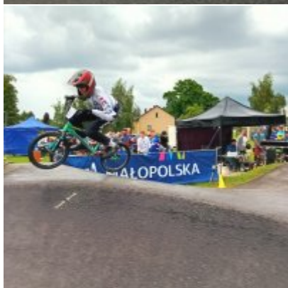
MIĘDZYNARODOWY PUCHAR POLSKI „PUMPTRACK”