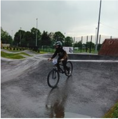
MIĘDZYNARODOWY PUCHAR POLSKI „PUMPTRACK”