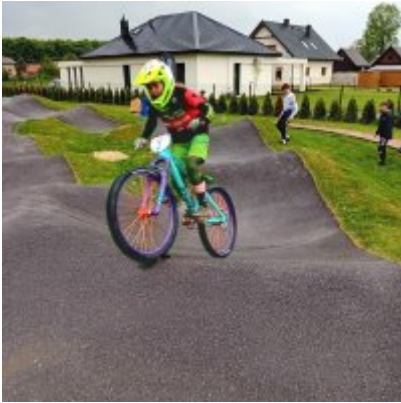
MIĘDZYNARODOWY PUCHAR POLSKI „PUMPTRACK”