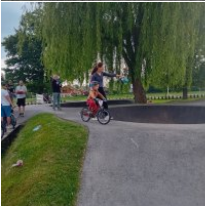
MIĘDZYNARODOWY PUCHAR POLSKI „PUMPTRACK”