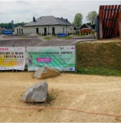
MIĘDZYNARODOWY PUCHAR POLSKI „PUMPTRACK”