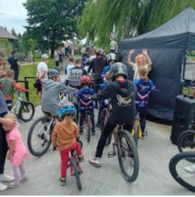
MIĘDZYNARODOWY PUCHAR POLSKI „PUMPTRACK”