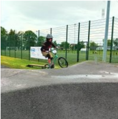
MIĘDZYNARODOWY PUCHAR POLSKI „PUMPTRACK”