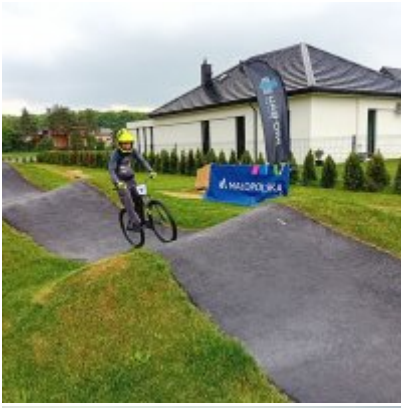
MIĘDZYNARODOWY PUCHAR POLSKI „PUMPTRACK”