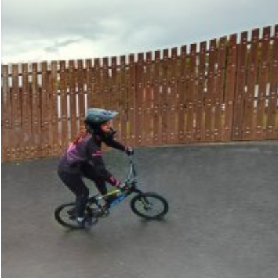
MIĘDZYNARODOWY PUCHAR POLSKI „PUMPTRACK”