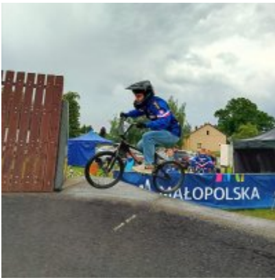
MIĘDZYNARODOWY PUCHAR POLSKI „PUMPTRACK”