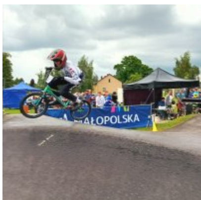
MIĘDZYNARODOWY PUCHAR POLSKI „PUMPTRACK”