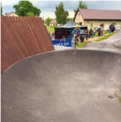
MIĘDZYNARODOWY PUCHAR POLSKI „PUMPTRACK”