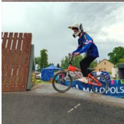
MIĘDZYNARODOWY PUCHAR POLSKI „PUMPTRACK”