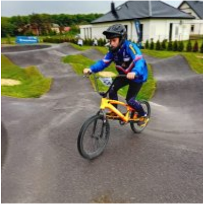
MIĘDZYNARODOWY PUCHAR POLSKI „PUMPTRACK”