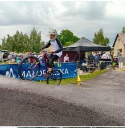
MIĘDZYNARODOWY PUCHAR POLSKI „PUMPTRACK”